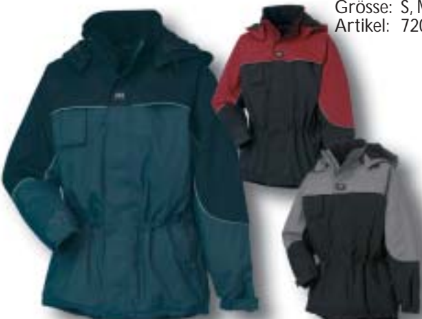
Helly-Techjacke wattiert abnehmbare Kapuze, Reflexstreifen, Entlüftung mit RV Farbe: marine/schwarz, schwarz/rot, schwarz/grau Grösse: S, M, L, XL, XXL Artikel: 71312 Fr. 189.-