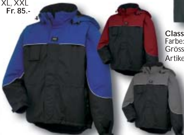
Helly-Techjacke wattiert Farbe: schwarz/kobalt, schwarz/rot, schwarz/grau Grösse: S, M, L, XL, XXL Artikel: 71311 Fr. 169.-