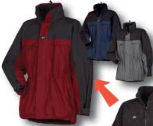
Zip-In Jacke Farbe: rot/schwarz, marine/schwarz grau/schwarz Grösse: S, M, L, XL, XXL Artikel: 71108 Fr. 179.-