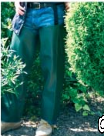
Ringsum Beinschutz für Freischneidarbeit, Jäger, Forstleute (ohne Polster) Artikel: 13051 71cm Fr. 85.- 13061 83cm Fr. 85.-