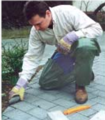
Garten- + Plattenarbeit grosses Kniepolster Artikel: 12071 Fr. 109.-