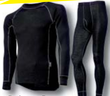
Bodywear Dry Hält Sie bei harter Arbeit u. Sport stets trocken und warm. Farbe: schwarz Grösse: S, M, L, XL, XXL Artikel: 75015 Kurzarm Fr. 47.- 75406 Damenhose, marine Fr. 41.-