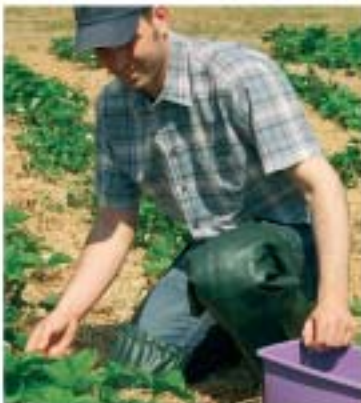
Gemüsebau, Gartenarbeit kleines Kniepolster Artikel: 12051 Fr. 105.-