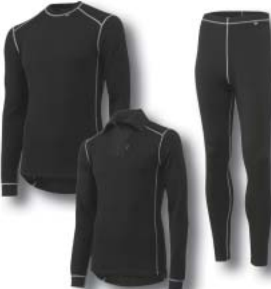
Bodywear Warm Diese warme, weiche Unterwäsche wird bei extremer Kälte getragen. Farbe: schwarz Grösse: S, M, L, XL, XXL Artikel: 75026 Langarm Fr. 69.- 75425 Hose ohne Eingriff Fr. 52.- 75027 Rollkragen mit RV Fr. 79.-