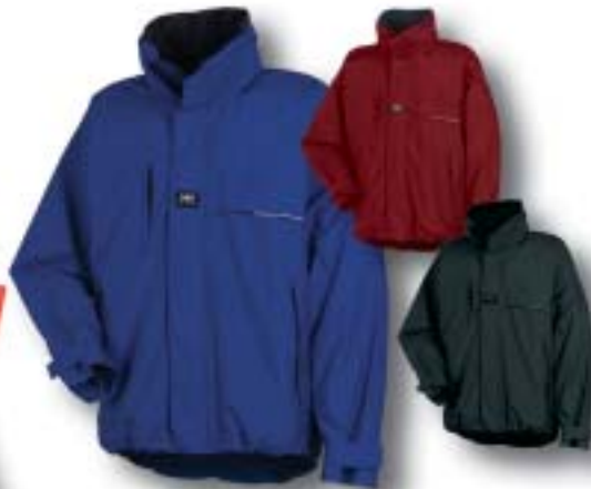
Zip-In Jacke wasserdicht, atmungsaktiv, Kapuze abnehmbar Farbe: kobalt, rot, schwarz Grösse: S, M, L, XL, XXL Artikel: 71105 Fr. 159.-