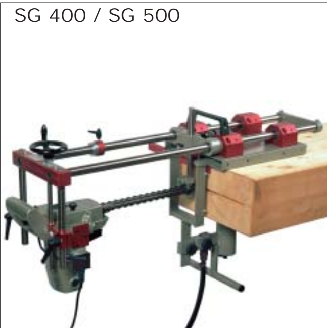
SG 400 / SG 500

Für Kettengarnitur verlangen Sie bitte separate Liste.